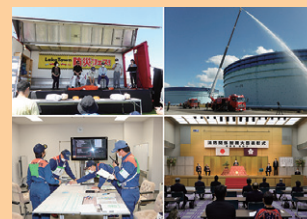
■ 表紙 本号掲載記事より